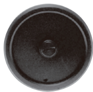
材質：プラスチック