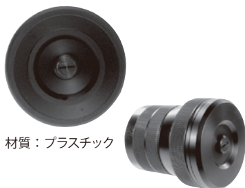
材質：プラスチック

ポート O リング接触面やネジを保護し、ゴミやホコリの侵入を防ぎます。移動時や保管時に使用します。